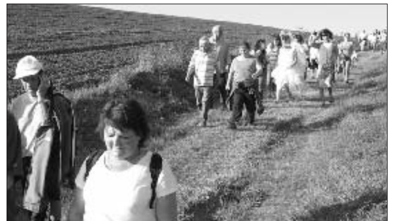
Noce et randonnée sur les chemins de campagne