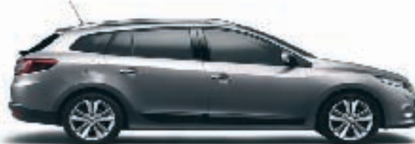
NOUVELLE MÉGANE ESTATE