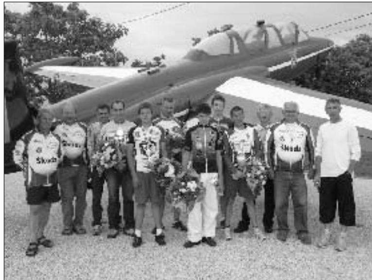
Le podium avec les vainqueurs et les membres du club organisateur

Seulement dix-sept coureurs ont pris le départ du 2 e Trophée des grimpeurs parfaitement organisé par le club Ufolep de l'Union cyclosporitive sarladaise.