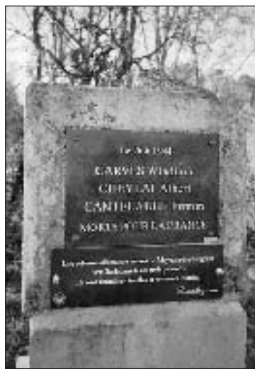
Stèle des Rhodes à Sarlat

Débutées les 8 et 9 juin, les traditionnelles cérémonies commémoratives aux stèles et monuments du Sarladais et du nord du Lot se poursuivront du 22 au 30 juin à l'initiative du comité sarladais de l'Anacr et des Amis de la Résistance, en liaison avec les municipalités et les anciens combattants.