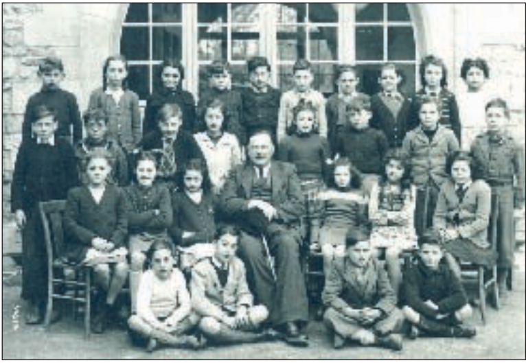
Photo de classe collège La Boétie vers 1948 (?) Les élèves se reconnaissent-ils soixante ans plus tard ?