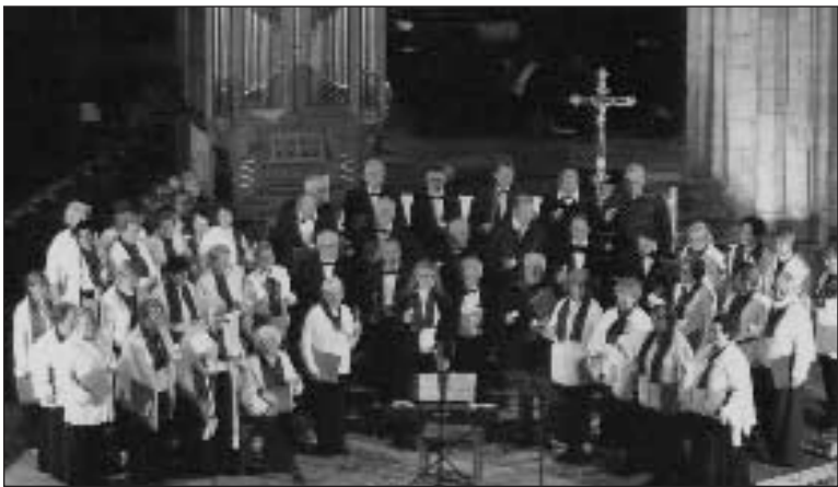
L'Ensemble vocal à la cathédrale de Sarlat