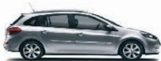
NOUVELLE CLIO ESTATE

VENEZ LA DÉCOUVRIR AUX PORTES OUVERTES DU 11 AU 15 JUIN